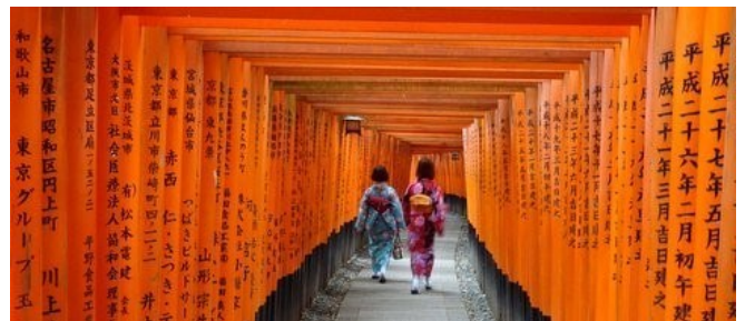
Immer ein Erlebnis: Besuch des Fushimi Inari-Schreines

Mi 14.01.26 / 7. Erlebnis-Tag: Tokyo-Kyoto Heute legen wir die 513 km lange Bahnstrecke von Tokyo nach Kyoto im Shinkansen ohne Umsteigen in 160 Minuten zurück; mit etwas Wetter-Glück haben wir unterwegs nochmals einen schönen Blick auf den Mt.Fuji. Nach Ankunft in Kyoto checken wir in unserem Hotel in Bahnhofsnähe ein. Am Nachmittag hat der stadtnahe Fushimi Inari-Schrein die besten Lichtverhältnisse zum Fotografieren. Der Schrein mit seiner kilometerlangen Tori-Galerie wurde durch den Film „Die Geisha“ weltberühmt.