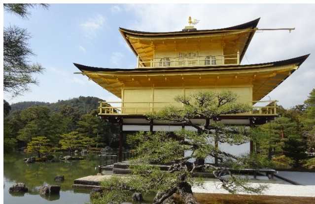
Wunderbar: der Goldene Pavillon in Kyoto