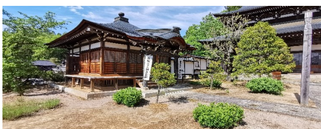
Takayama am Rande der japanischen Alpen

Sa 17.01.26 / 11. Erlebnis-Tag Heute unternehmen wir einen Ausflug per Eisenbahn in das 60 Zug-Minuten entfernte Nara , Nara war von 710 bis 784 die erste permanente Hauptstadt Japans und ist daher noch älter als Kyoto. In Nara werden wir von hunderten zahmen, frei herumlaufenden Rehen überrascht. Überall gibt es Verkaufsstellen, die Futter für die Rehe liefern – die Rehe fressen uns das Futter aus der Hand. Unser Ziel ist jedoch der Todai-ji-Tempel , das größte Holzgebäude der Welt mit einer gigantischen Buddhastatue aus Bronze. Im Hirschpark von Nara besuchen wir auch die wunderschöne Tempelanlage Kasuga-Taisha-Schrein.... 3000 Steinlaternen säumen den Zugang. Rückfahrt von Nara nach Kyoto. Übernachtung in Kyoto.