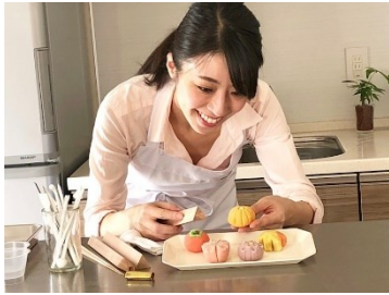
Foto: Profi-Köchin Mai ist Expertin für Wagashi und zeigt Ihnen die Herstellung japanischer Süßigkeiten