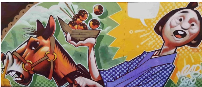
Street-Art in Osaka

Alleinreisende zahlen einen Aufpreis von 399.00 Euro für die Belegung eines Einzelzimmers.