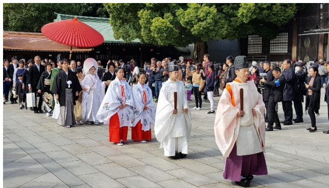
Hochzeit im Meiji Schrein

Fr 09.01.26 / 2. Erlebnis-Tag Ankunft am Flughafen Narita oder Haneda. Fahrt nach Tokyo, Check-In im Hotel im Stadtteil Ginza und Übernachtung in Tokyo.