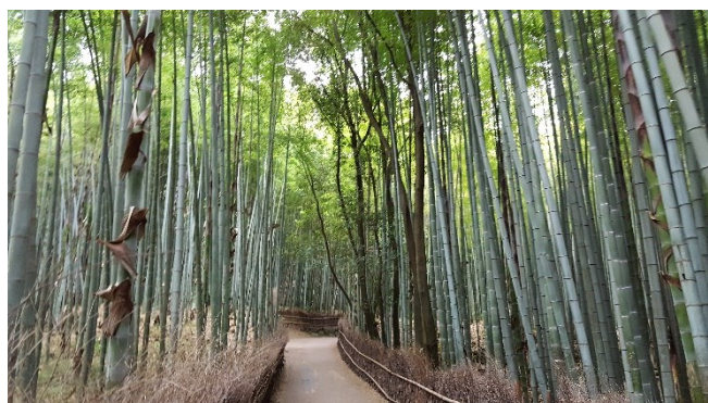
Bambuswald von Arashiyama

Altstadt von Kyoto: mit dem Kiyomizu-dera – Tempel Goldener Pavillon – das Schmuckstück im Norden von Kyoto das Stadtzentrum mit dem berühmten Nishiki-Markt, wo Sie allerlei japanische Spezialitäten probieren können Übernachtung in Kyoto.