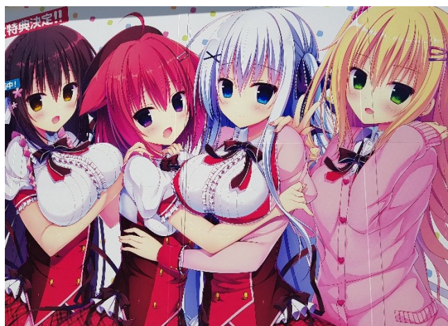
Herrlich verrückt: das Szene-Viertel Akihabara mit 1001 Foto-Motiven

So 11.01.26 / 4. Erlebnis-Tag: ein weiterer Besichtigungstag in Tokyo: wir bieten Ihnen heute