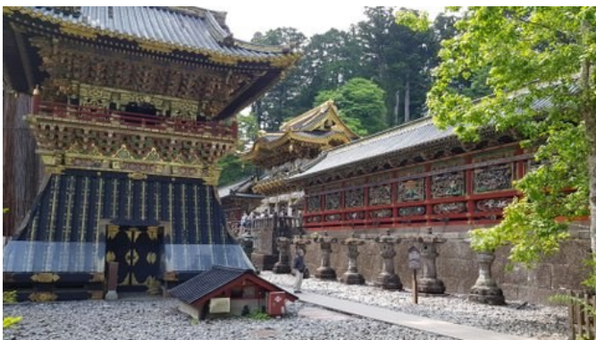
Unvergleichlich schön: die „Barockstadt“ Nikko

Mo 12.01.26 / 5. Erlebnis-Tag: Heute unternehmen wir einen Tagesausflug in die Nähe vom Mt. Fuji – dem heiligen Berg. Wir fahren nicht in den Hakone Nationalpark (wie bei unserem Reise-Programm „Höhepunkte von Japan“), sondern nach Kawaguchi-ko und kommen somit viel näher an den Mt. Fuji heran. In den Wintermonaten ist die Wahrscheinlichkeit sehr groß, daß sich der 3777 m hohe Berg mit Schneehaube bei klarer Sicht zeigt. Rückkehr nach Tokyo und Übernachtung in unserem Hotel in Ginza.