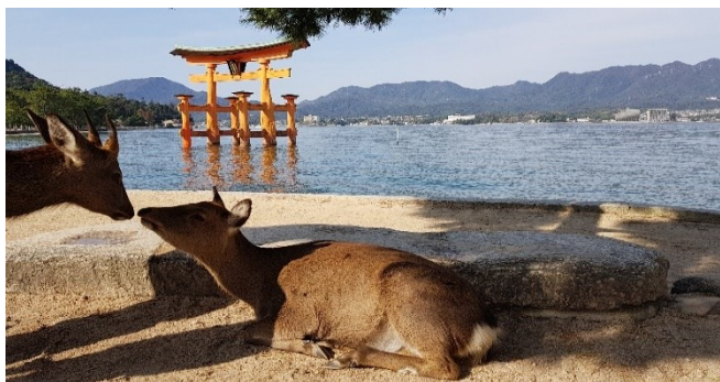
Insel Miyajima vor den Toren Hiroshimas

Fr 16.01.26 / 9. Erlebnis-Tag: Fahrt mit dem Shinkansen von Kyoto nach Hiroshima . Hiroshima –die Partnerstadt von Hannover- ist ein „Muss“ für jeden Japan-Reisenden. Ein Besuch des „Memorial Peace Parks“ als Gedenkstätte zum ersten Atomwaffen-Einsatz gegen Zivilisten bleibt unvergesslich. Nach dem Besuch des „Peace Parks“ setzen wir mit einer modernen Fähre hinüber zur Insel Miyajima. Weltberühmt ist dort das hölzerne Torii aus dem Jahr 1875, das etwa 160 Meter vor dem Schrein steht. Bei Ebbe kann es zu Fuß erreicht werden, bei Flut steht es vollständig im Wasser. Es ist eines der meistfotografierten Wahrzeichen Japans. Der Schrein und das Torii wurden 1996 von der Unesco zum Weltkulturerbe erklärt. Wir werden zahme Rehe bewundern, die überall auf der Insel anzutreffen sind und keine Scheu vor Menschen haben. Rückfahrt mit dem Shinkansen nach Kyoto und Übernachtung im Hotel in Kyoto.