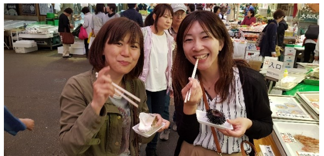
Austern und Seeigel ganz frisch ... im Ohmicho-Markt von Kanazawa

Mi 14.01.26 / 7. Erlebnis-Tag: Tokyo-Kyoto Heute legen wir die 513 km lange Bahnstrecke von Tokyo nach Kyoto im Shinkansen ohne Umsteigen in 160 Minuten zurück; mit etwas Wetter-Glück haben wir unterwegs nochmals einen schönen Blick auf den Mt.Fuji. Nach Ankunft in Kyoto checken wir in unserem Hotel in Bahnhofsnähe ein. Am Nachmittag hat der stadtnahe Fushimi Inari-Schrein die besten Lichtverhältnisse zum Fotografieren. Der Schrein mit seiner kilometerlangen Tori-Galerie wurde durch den Film „Die Geisha“ weltberühmt.