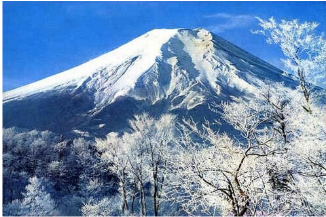
Mt. Fuji – besonders im Winter ein herrlicher Anblick

Auch die Luxusmeile „Ginza“ ist heute eine Fußgängerzone, Sie haben Zeit, die Luxus-Kaufhäuser Mitsukoshi und Matsuya zu besuchen, wo es in der Lebensmittel-Etage auch Niederlassungen von „ Feinkost-Käfer “ aus München und der „ Holländischen Kakaostube “ aus Hannover gibt.